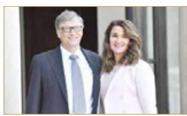
بيل غيتس وطليقته ميلندا

كشفت صحيفة "وول ستريت جورنال" الأميركية أن أعضاء مجلس إدارة شركة "مايكروسوفت" اتفقوا العام 2020 على حاجة بيل غيتس للتخني عن منصبه، وسط تحقيقات أجريت بشأن علاقة رومانسية سابقة كانت تربط الملياردير الأمريكي بموظفة في الشركة نفسها واعتبرت "غير لائقة". وقال أشخاص مطلعون على الأمر إن أعضاء مجلس الإدارة تفاقدوا مع شركة محاماة لإجراء التحقيق في أواخر العام 2019، بعد أن زعمت مهندسة في مايكروسوفت، في رسالة، أنها أقامت "علاقة جنسية" على مدار سنوات مع غيتس. وأثناء التحقيق، قرر بعض أعضاء مجلس الإدارة أنه "لم يعد مناسباً لغيتس أن يتسلم منصب مدير الشركة، التي أسسها وقادها لعقود. وذكر شخص آخر مطلع على الأمر أن بيل "استقال قبل اكتمال تحقيق مجلس الإدارة وقيل أن يتخذ مجلس الإدارة قرارا رسميا بشأن هذه المسألة". وقال المتحدث باسم مايكروسوفت "تلتفت مايكروسوفت لنا مقلتا في النصف الأخير من العام 2019، وتتعلق مساعي بيل غيتس لبدء علاقة حميمة مع إحدى موظفات الشركة في العام 2000.