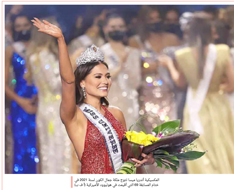
المسابقة أندريا ميسا تنوج ملكة جمال الكون لسنة 2021 في ختام المسابقة 69 التي أقيمت في هوليوود الأمريكية

إدارة التحرير: +973 17111444 / +973 1711467 / +973 385 @albiladpress.com / +973 32224492 / 39615645 / +973 1711501 / 508 قسم الإعلانات: +973 17580939 / +973 1711432 / +973 67133 / +973 1711434